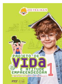
Projeto de vida e atitude empreendedora- 1 FTD - metodologia OPEE Projeto de vida