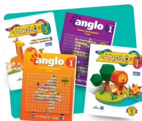
Sistema de ensino Anglo – 2024