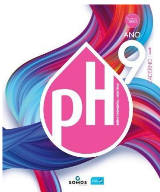
SISTEMA DE ENSINO pH – 9º ANO